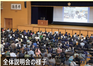
全体説明会の様子

2024年度の片山学園中学校入試の変更点や注意点、特待生基準、学校の最新情報などについて詳しくお話しします。