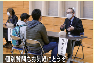
個別質問もお気軽にどうぞ