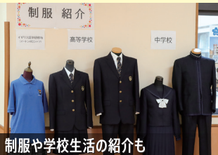
制服や学校生活の紹介も